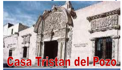
Casa Tristan del Pozo

Museo de la Tercera Orden Franciscana, decorado con un entorno de casonas de alcurnia y abolengo, en las calles Zela, Ugarte y San Francisco; luego visitaremos la Casa Tristán del Pozo, casona colonial de fachada tallada en estilo barroco mestizo, su construcción data del año 1738, actual sede del Banco Continental. Casa del Moral, casona típica del siglo XVIII, uno de los más antiguos monumentos arquitectónicos, con una portada hecha en sillar, verdadera obra de arte en la que se aprecian figuras cuidadosamente talladas, actualmente sede del Banco de Crédito.