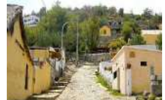
IGLESIA SAN JOSE DE QUEQUEÑA