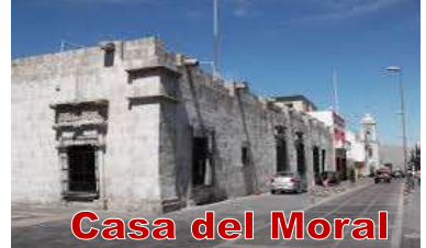
Casa del Moral

Continuaremos conociendo la Casa del Gobernador y la Casa Goyeneche. Retorno al alojamiento, descanso. HOTEL